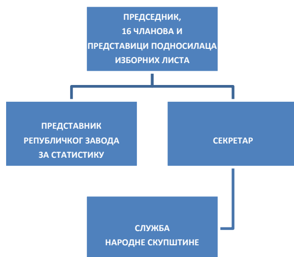
(Grafički prikaz organizacione strukture Republičke izborne komisije - PROŠIRENI SASTAV)

Prilikom sprovođenja izbora Komisija radi u PROŠIRENOM sastavu i čine je, osim predsednika, članova, sekretara, njihovih zamenika i predstavnika republičke organizacije nadležne za poslove statistike, i po jedan predstavnik podnosilaca izbornih lista, odnosno predlagača kandidata za predsednika Republike.